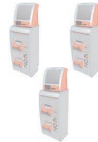
Kiosk 7000 (erweiterbar bis zu 10 Terminals)